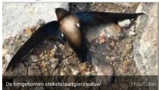
De omgekomen stekelstaartgierzwaluw

Vogels worden wel vaker voor Israëlische spionnen aangezien in Turkije. In mei 2012 berichtte de BBC over een 'aangehouden' vogeltje, een Europese bijeneter. Ook dit diertje had een ringetje om waaruit bleek dat het uit Israël afkomstig was. Het beestje werd onderzocht op spionageapparatuur omdat het wel erg grote neusvleugels zou hebben.